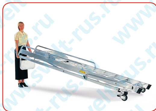
В сложенном виде можно перевозить на колесах