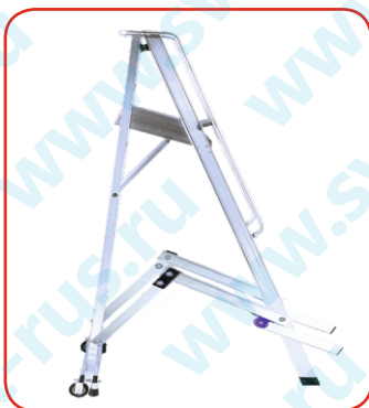
Завершение фазы 2