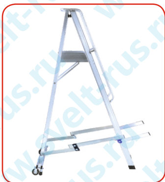
Завершение фазы 1