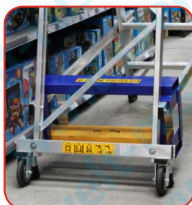
Траверса 75 см.