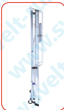
Минимальные транспортные габариты