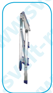
Bobo: 14 см.

Случайное открывание предотвращается двумя оцинкованными стальными стержнями. Упаковка: термоусадочная пленка (82x14x42 см.) Ступени: 80 мм. Алюминиевый профиль: 40x20 мм.