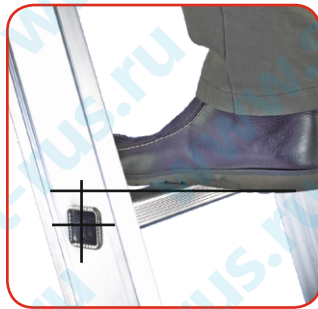
Плоские ступеньки (максимальный комфорт)