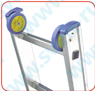
Колеса для подъема лестницы