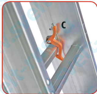
Устройство защиты от случайного складывания