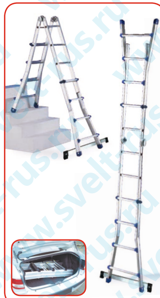
Scalissima Plus 8 + 8A

* Модели (A*) соответствуют европейским стандартам, в комплекте траверсы SALLARUS 3 или 5, в лестницах уже просверлены отверстия для крепления траверсы.