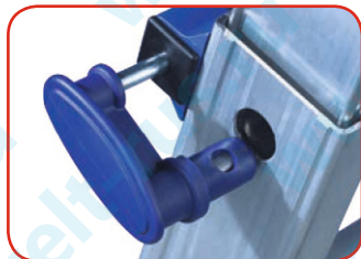
Стальные предохранительные крючки с нейлоновым покрытием.