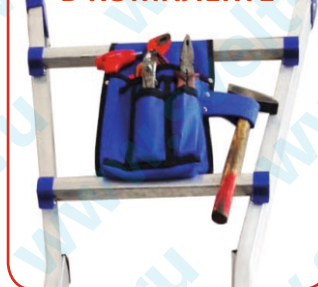
Сумка для инструментов в комплекте