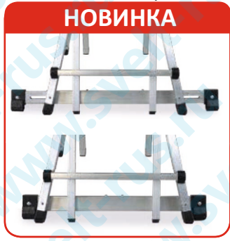
SALLAR84 и SALLAR113