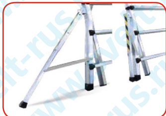
Складные телескопические стабилизаторы