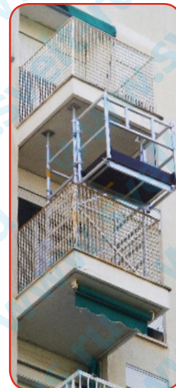
Другие размеры под заказ