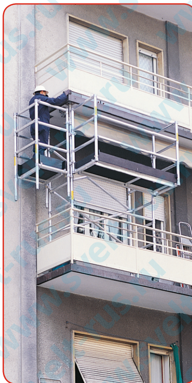
Вылет спереди и сбоку

Небольшое количество компонентов делает его очень легким и простым в сборке и транспортировке.