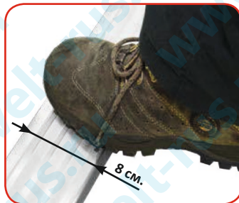
Нескользкие ступени шириной 8 см.