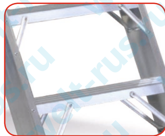
Усиление на всех ступенях с обеих сторон