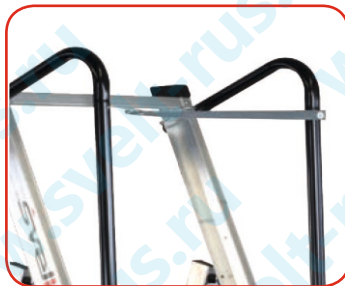
Защитный ремень 360°

СООТВЕТСТВУЕТ Законодательному декрету 81/08