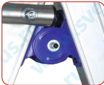
Стальная петля увеличенного размера