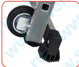
Колеса диаметром 125 мм.