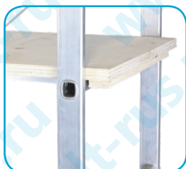
Деревянная платформа с алюминиевым каркасом