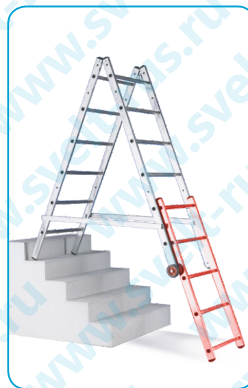
Положение: стремянка с доп. рамой для работы на лестнице