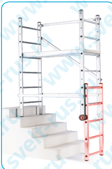
Положение: подмости с дополнительной рамой для работы на лестнице