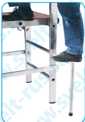
Внешняя ступенька для удобного подъема на платформу