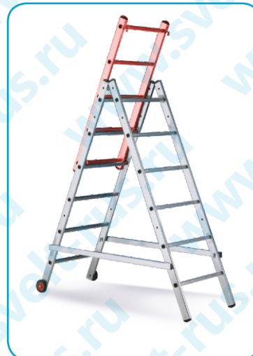
Положение: стремянка с перилами