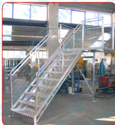
С защитной сеткой

Только опорные кронштейны или стойки поставляются в разобранном виде. Ширина подъема может быть 60 см., 80 см. или 100 см. Специальные размеры по запросу. Кронштейны для настенного монтажа являются обязательными, но так же могут быть предоставлены заказчиком.