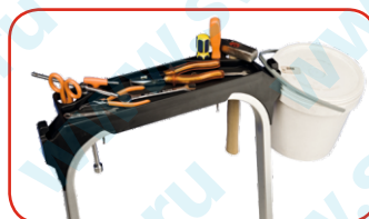
Лоток для инструментов