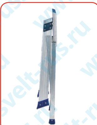
Ширина сложенных 16 см.

Оснащены большой, прочной и удобной нескользящей алюминиевой платформой. Конструкция имеет чрезвычайно широкую опору, которая предотвращает скольжение и опрокидывание подмостей, даже когда оператор ставит ноги на края платформы. Двойная система защиты от случайного открывания, состоящая из алюминиевых стержней и автоматической панели.