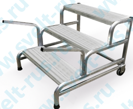
Cargo 3 ступени с комплектом ручек + колеса