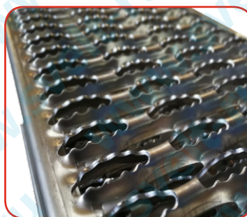
Алюминиевые решетчатые ступени (опция)