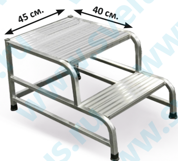
Cargo 2 ступени и увеличенная площадка

Европейский стандарт UNIEN14183: с Cargo 1, 2 и 3 ступеньками оператор может стоять на последних ступенях или на платформе даже без поручня (опция). Только для 4 ступеней необходимо наличие поручня высотой 60 см.