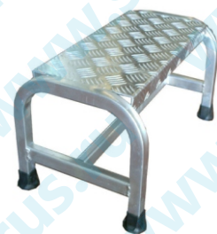
Cargo 1 ступень.