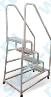
Левые и правые боковые перила