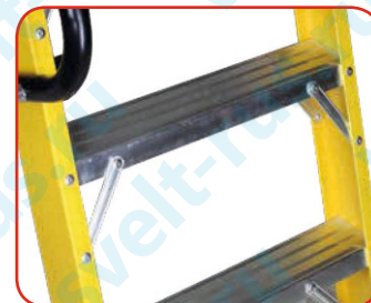
Усиление всех ступеней с двух сторон