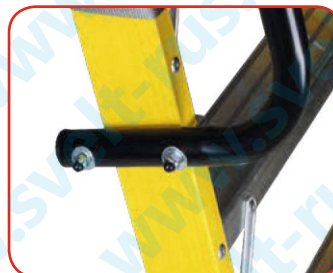
Поручни крепятся на винты