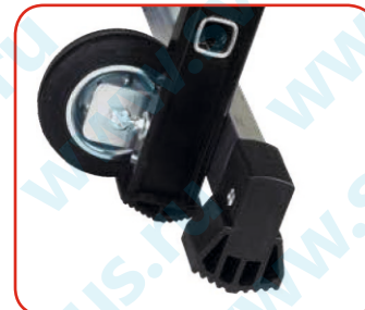
Колеса диаметром 150 мм.