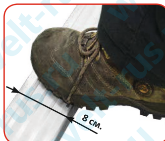
Плоские ступени шириной 8 см.